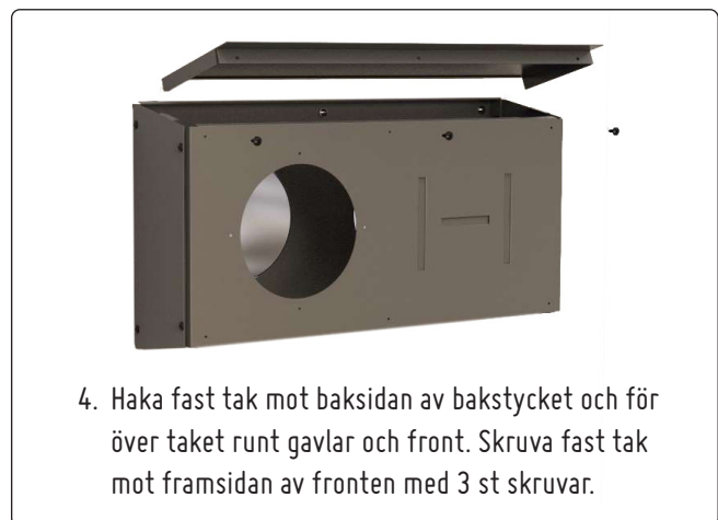
4. Haka fast tak mot baksidan av bakstycket och för över taket runt gavlar och front. Skruva fast tak mot framsidan av fronten med 3 st skruvar.