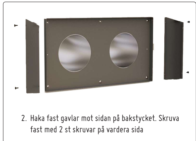
2. Haka fast gavlar mot sidan på bakstycket. Skruva fast med 2 st skruvar på vardera sida