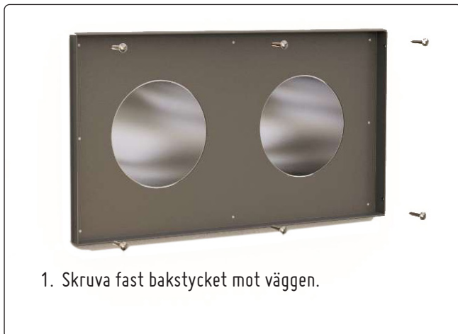
1. Skruva fast bakstycket mot väggen.