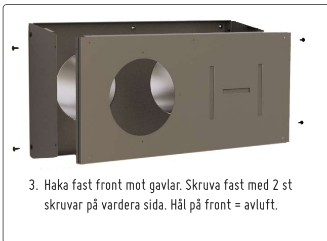
3. Haka fast front mot gavlar. Skruva fast med 2 st skruvar på vardera sida. Håll på front = avluft.